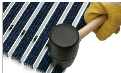
Neue Ripsstreifen mit Selbstklebeband in das Aluprofil einkleben und ggf. mit einem Gummihammer den Klebeprozess verstärken.