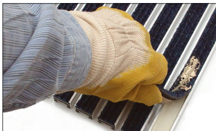
Mit einem handelsüblichen Schraubendreher den Anfang des Ripsstreifens vom Aluprofil lösen und entfernen.

brauchten Ripsstreifen werden aus dem Aluprofil der Matte gelöst, in der Unterkonstruktion verbliebene Rückstände und Schmutz werden entfernt. Die neuen Ripsstreifen werden mit einem Selbstklebeband auf der Rückseite versehen und eingeklebt.