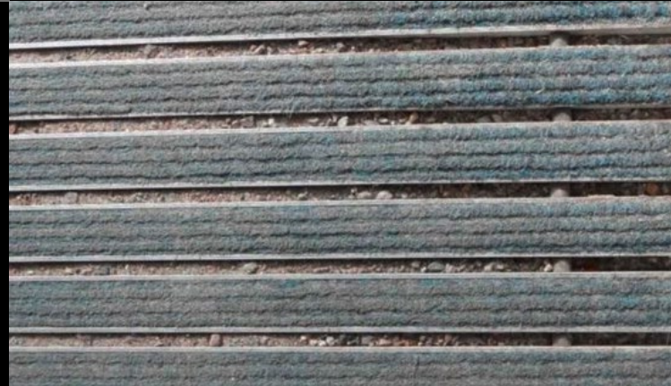
Eingangsmatte einer Bankfiliale vor der Reinigung (oben) und nach ihrer biologisch-technischen Reinigung (unten)

Schlecht gepflegte Fußmatten in den Eingangsbereichen von öffentlichen Gebäuden, Krankenhäusern, Schulen und Firmen mit starkem Publikumsverkehr nehmen schnell Schaden, können zu Stolperfällen werden und Unfälle verursachen.