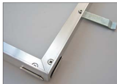
Winkelrahmen mit Eckverbinder und Maueranker (Lieferung erfolgt ohne Montage)