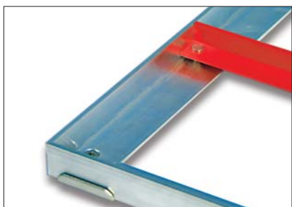
Die roten Winkelprofile dienen als Einbauhilfe bei Rahmen über 2 m Seitenlänge