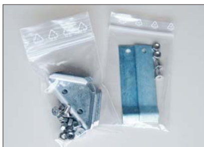
Winkelverbinder und Maueranker werden lose mit dem Winkelrahmen geliefert