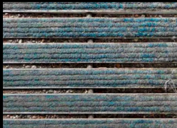
Eingangsmatte einer Bankfiliale vor der Reinigung (oben) und nach ihrer biologisch-technischen Reinigung (unten)

Unsere regelmäßige Wartung und der Einsatz von biologisch hochwirksamen Reinigungsmitteln reduzieren den Eintrag dieser mikrobiellen Verschmutzungen und tragen so wesentlich zu einer gesunden und keimfreien Raumluft bei.